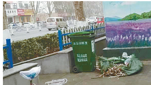
湘江西路与文化路交叉口向东约30米路南,垃圾乱堆放。