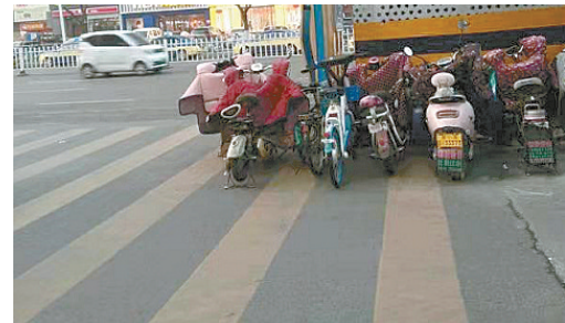
人民西路与交通南路交叉口向西约150米路南,电动车停在斑马线上。