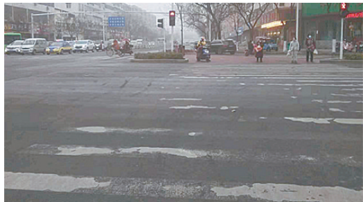
交通南路与湘江西路交叉口,斑马线模糊不清。