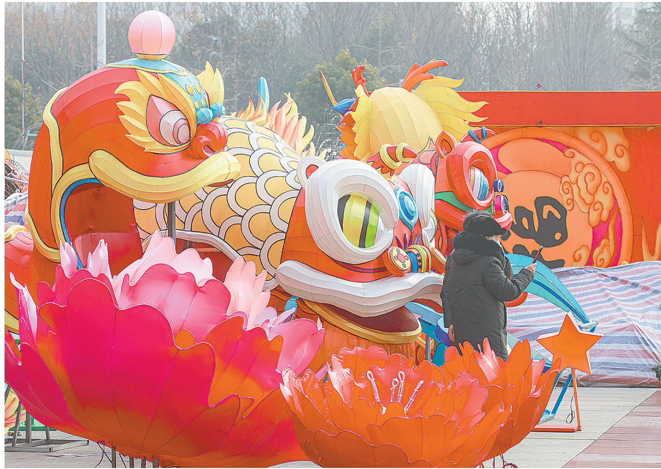
春节越来越近了,年味越来越浓。近日,在市科教文化艺术中心广场一角,专业花灯制作团队正在加班加点赶制花灯。这些花灯将在春节期间与市民见面。

针对光明中路市场北口车辆拥堵这一情况,市城管局综合执法支队召陵大队协调相关部门将市场中间商户南撤50米,为学生放学解散留足空间;积极开展校园周边环境秩序整治行动,对学校周边占道经营、非机动车乱停乱放等行为进行治理,并设置护学岗,确保学校周边环境秩序良好。