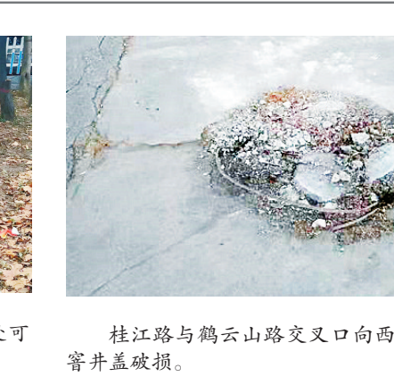
桂江路与鹤云山路交叉处向西约50米路南，窨井盖破损。