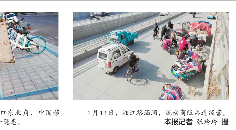
1月13日，湘江路涵洞，流动商贩占道经营。本报记者 张玲玲 摄