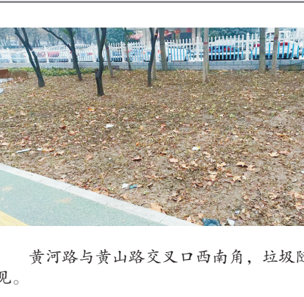
黄河路与黄山路交叉处西南角，垃圾随处可见。