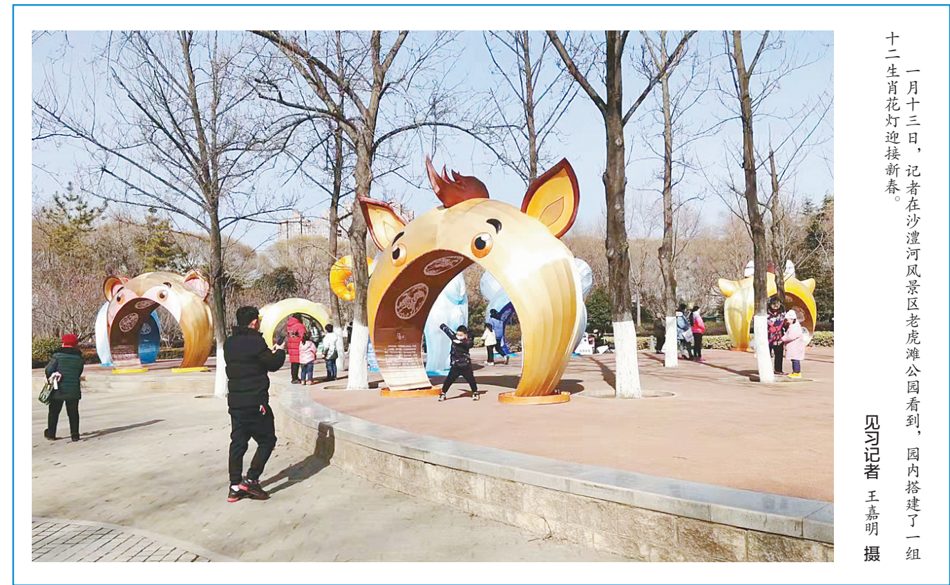
十二月十三日，记者在沙澧河风景区老虎滩公园看到，园内搭建了一组十二生肖花灯迎接新春。