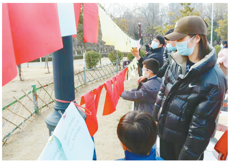
2月10日下午,市爱卫办在崂山路南头健康主题公园开展“爱国卫生运动70周年”元宵节爱卫知识竞赛活动。