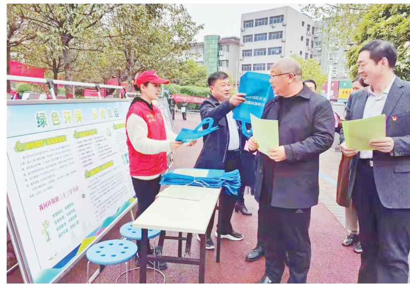
郾城区爱卫中心工作人员开展病媒防制知识宣传(资料图)。