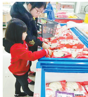
市民在挑选元宵。

一年一度的元宵节将至。作为传统食品，元宵是元宵节期间主要的消费食品之一。目前市场上销售的多为速冻元宵，在选购时需要注意哪些事项呢？消协提示广大消费者： 一是到正规商场、超市购买质量稳定的品牌产品。 二是要购买标识齐全的元宵。购买时注意食品包装标识是否齐全，检查外包装上是否印有“SC”生产许可标志，是否标有名称、规格、净含量、生产日期、配料表、厂名、厂址、电话、保质期、产品标准代号等内容。 三是购买袋装元宵时要仔细检查外包装，选择那些密封完好、无黏结、无破损和变形的元宵；如袋内有较多冰屑的话，可能是产品解冻后又冻结造成的，最好不要购买。 四是在购买散装元宵时，一定要选择卫生条件好、证照齐全、信誉好的经营单位。检查元宵是否新鲜、有无杂质等。散装产品现场生产为佳。同时，要注意质价相符，尽量不要购买价格过低的元宵，谨慎购买街边摊点的散装产品。 五是在购买为特殊人群特