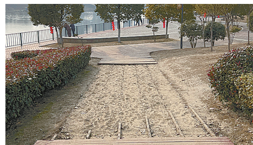
解放路沙河大桥东侧沙漯河风景区,木栈道破损。