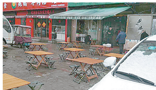
漓江路与燕山路交叉口向东约180米路北,有商家店外经营。