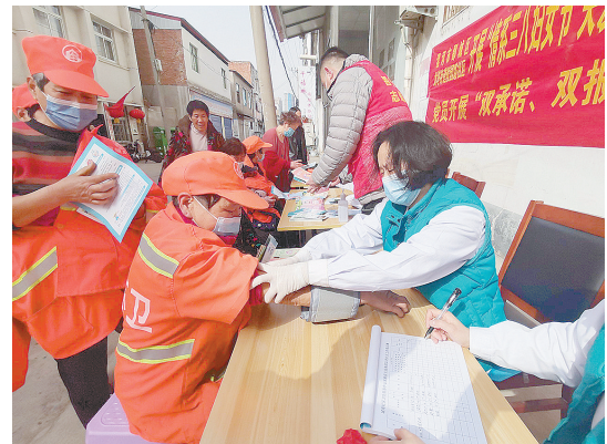
3月7日,郾城区龙塔街道陵园路社区联合城南社区卫生服务中心举办“情系‘三八’妇女节 关爱女性健康”爱心义诊活动。