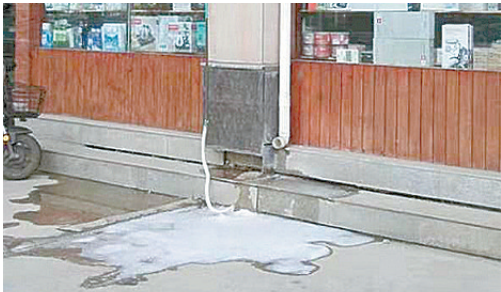
长江路与月亮山路交叉口向东约20米路南,商户乱排污水。