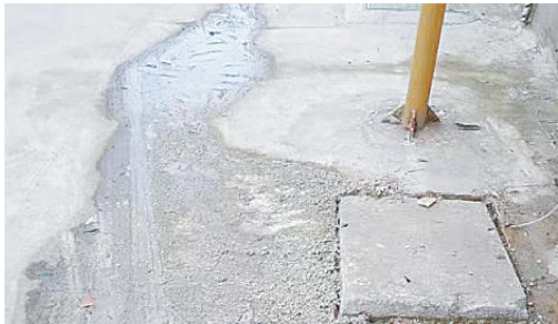
黄河中路与泰山北路交叉口向西约150米路南,下水道堵塞,污水外溢。