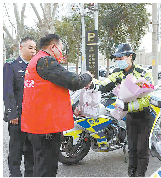
3月7日,漯河市“爱心爸妈”公益团志愿者到市区黄河路与泰山路交叉口,为值班女交警送上节日礼物。