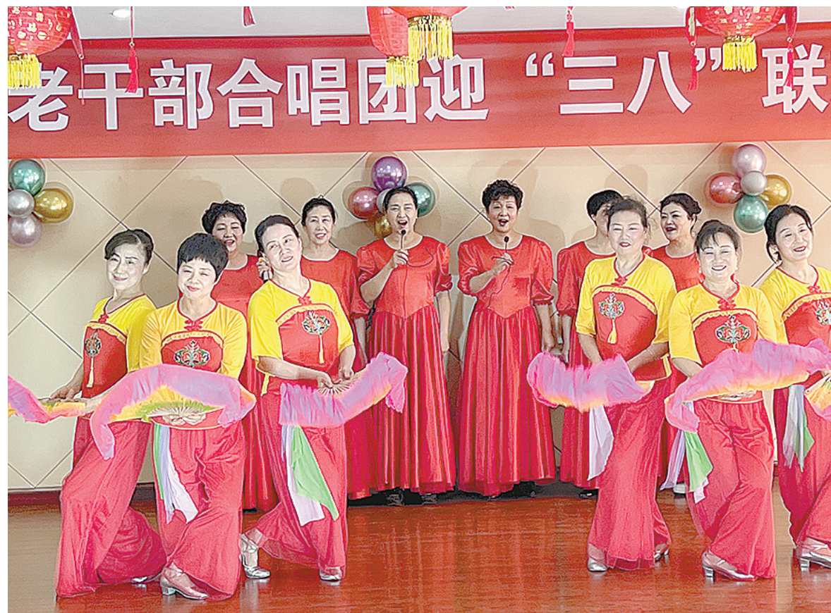
3月7日,市老干部合唱团举办迎“三八”联欢会。