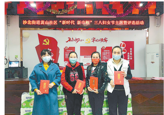
3月7日,郾城区沙北街道嵩山社区举办“三八”妇女节评选活动,对评选出的“最美网格员”“最美志愿者”等进行表彰。