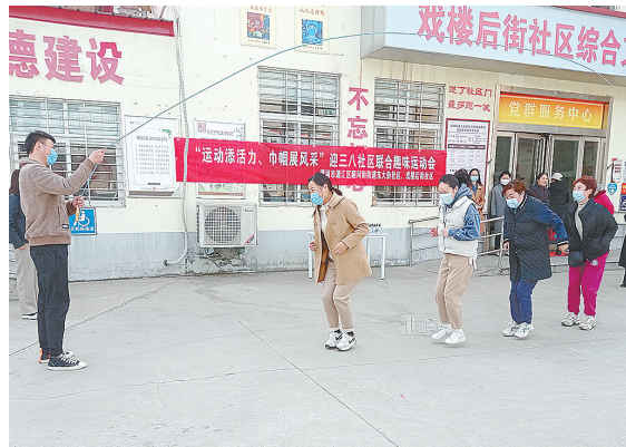
3月7日,源汇区顺河街街道东大街社区和戏楼后街社区联合举办“运动添活力 巾帼展风采”趣味运动会。