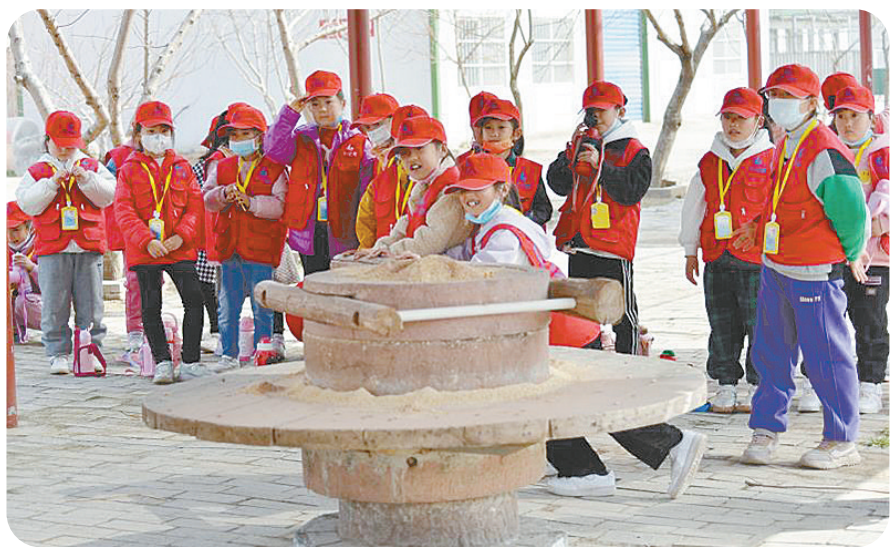
小记者体验用石碾磨玉米面