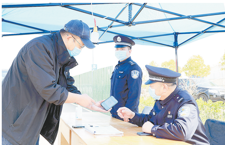
近日,全市公安机关民警、辅警严格落实疫情防控措施,全天坚守执勤卡点,坚决打赢这场疫情防控阻击战。图为3月29日,民警在五一路南段疫情防控执勤卡点开展工作。