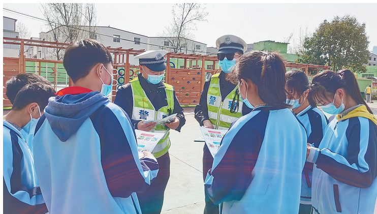
3月28日,市公安局交通管理支队城乡一体化示范区大队民警到半截塔小学为学生上交通安全课。