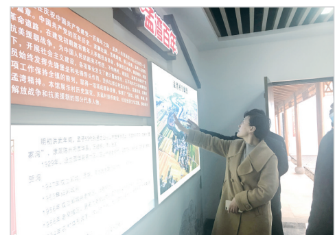
老窝镇武湾村打造的乡贤馆吸引大批市民前往参观。

建立乡贤能人资源库。按照“德行好、才能强、声望高、影响大”标准,深入动员、广泛摸底,挖掘乡贤能人。对内,注重从优秀大学毕业生、复员退伍军人、农村致富能人等群体中,找寻“隐藏”的乡贤能人;对外,注重从企业经营管理人才、高学