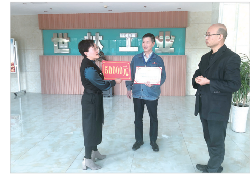
上门为服务召陵高质量发展的乡贤能人送荣誉。

织、搭建返乡创业平台、选树乡贤典型,不断汇聚乡贤力量,盘活乡贤资源,为乡村振兴提供强有力的人才支撑,探索出了乡贤能人有效助力乡村振兴的召陵模式。目前,返乡创业乡贤共投资1.46亿元,兴办企业、合作社91个,带动1379人就业,同时提供有价值招商信息23条,引进招商项目13个,总额达2.16亿元,得到了市委书记刘尚进的充分肯定。