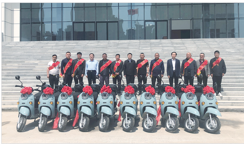
召陵区委对荣获“2021年度服务召陵高质量发展人才”称号的10名乡贤能人进行表彰和奖励。

织、搭建返乡创业平台、选树乡贤典型,不断汇聚乡贤力量,盘活乡贤资源,为乡村振兴提供强有力的人才支撑,探索出了乡贤能人有效助力乡村振兴的召陵模式。目前,返乡创业乡贤共投资1.46亿元,兴办企业、合作社91个,带动1379人就业,同时提供有价值招商信息23条,引进招商项目13个,总额达2.16亿元,得到了市委书记刘尚进的充分肯定。