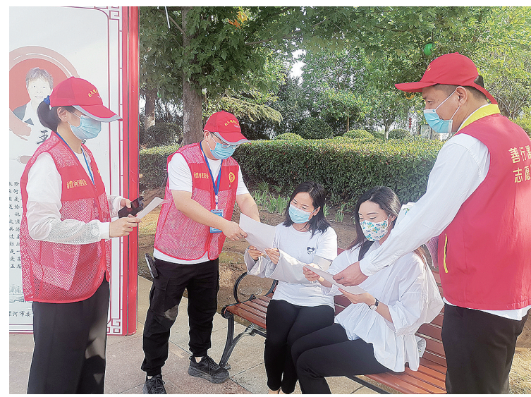
6月12日，市沙澧河建管委组织40余名志愿者在沙澧河风景区开展文明旅游宣传。

“培养一只合格搜救犬的时间一般为两年。其间，搜救犬要经历成千上万次训练。”高智文说，培养一只合格的搜救犬，需要耐心和毅力。每一名训导员对待搜救犬就像对待自己的孩子，不厌其烦地教会其本领。