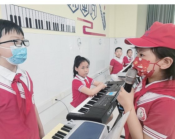
▲小记者采访正在上声乐课的同学。