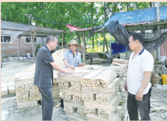
到工厂开展法律宣传。