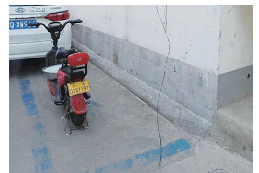
拥政街与受降路交叉口附近，线缆垂落。