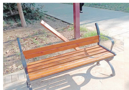
嵩山南路与柳江路交叉口向北约180米路西，公共座椅破损。