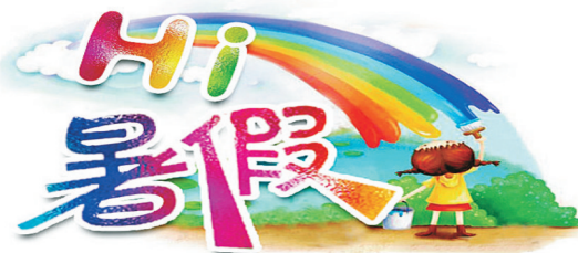
本报记者 范子恒 摄

暑假到来，社区党群服务中心成了辖区孩子的好去处。图为7月10日，孩子们在西城区新城办月湾湖社区党群服务中心湖畔书院学习。