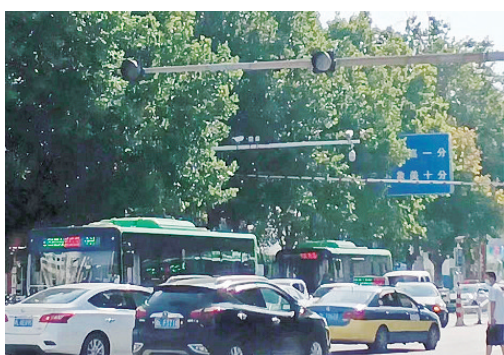
人民东路与银鸽路交叉口，交通信号灯不亮。