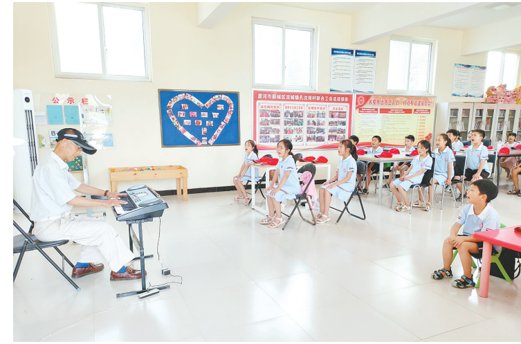
在孔沈邓村暑期爱心托管班，志愿者教孩子们唱歌。