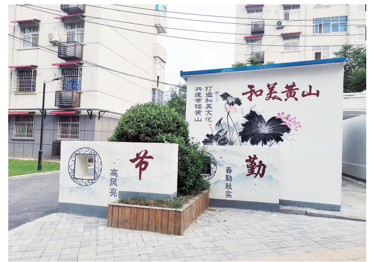
小区建筑物外墙上绘制了以“和美黄山”为主题的图画。