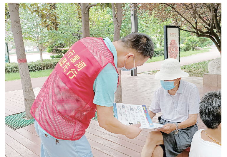
7月17日，郾城区龙塔街道工作人员在黄河广场针对老年人开展防诈骗宣传。