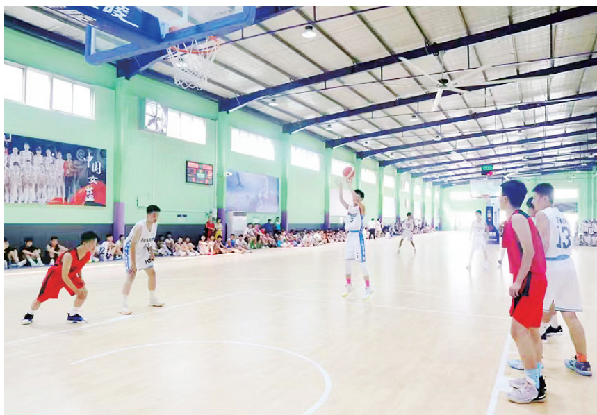
7月15日上午，2022年漯河市中小学生学习篮球比赛在市实验中学开赛。本次比赛为期6天，共有89支代表队报名，分为高中男子组、高中女子组、初中男子组、初中女子组、小学男子组、小学女子组、小学混合组。各组分别设一等奖、二等奖、三等奖和体育道德风尚奖。

“举办体验赛是为了让选手提前熟悉一下比赛形式和流程。”大赛组委会负责人说，“欢迎大家积极报名参加体验赛。咨询电话13781707655。”