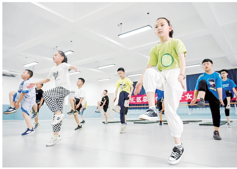
源汇区总工会举办职工子女暑期爱心托管班，义务向职工子女提供篮球、书法、绘画、音乐、手工制作等课程服务，让孩子们在快乐过暑假的同时学有所长、学有所得。图为7月15日，托管班的孩子们在源汇区实验学校锻炼身体。

记者了解到，这种既“托”又“管”还“教”的爱心托管形式，既解决了职工的后顾之忧，也有利于孩子的健康成长。目前，全区十余家单位的职工子女报名参加。不少家长表示，希望举办爱心托管班常态化、长效化。