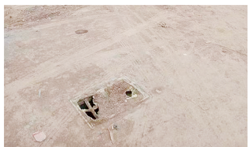
黄河东路与香山路交叉口向东约150米路北，人行道上井盖破损。