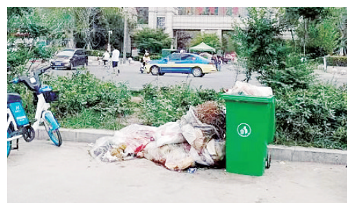
辽河路天鑫现代城小区附近，垃圾无人清理。