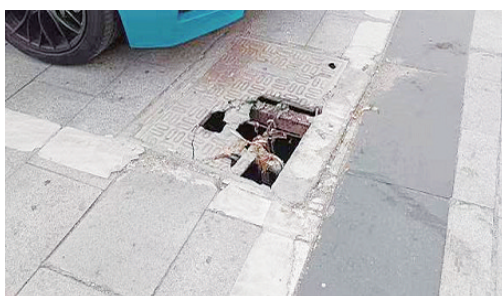
金山东路与黄河中路交叉口向南约30米路东，银河湾小区停车场井盖破损。