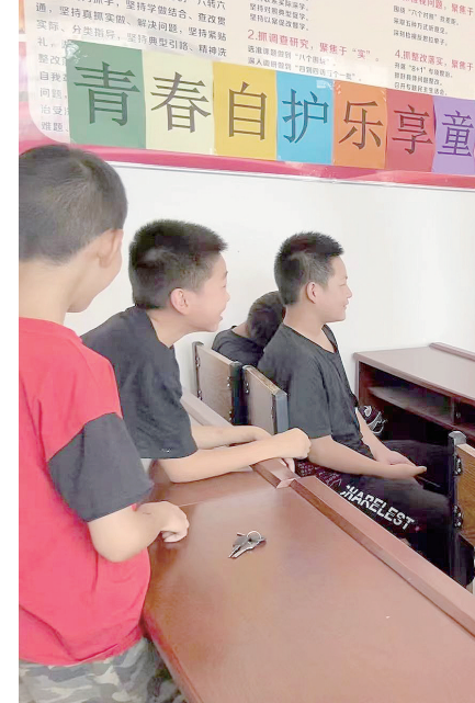
7月19日,郾城区龙城镇社工到西刘村开展“青春自护 乐享童年”安全教育。