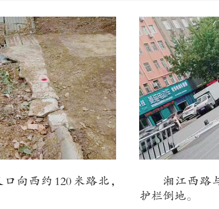
湘江西路与太行山南路交叉口东侧,交通护栏倒地。