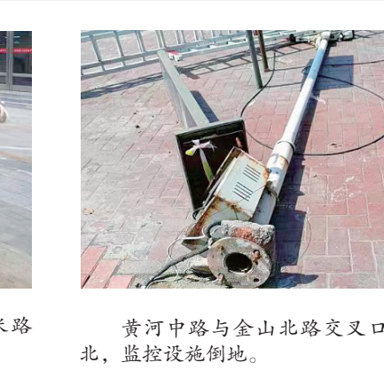
黄河路与金山北路交叉口向东约3米路北,监控设施倒地。