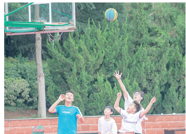
天气凉爽,孩子们打着篮球,开心极了。

本报讯(记者 杨光)记者从市气象台获悉,7月19日20时至20日7时,我市普降小雨,最大降水量出现在临颍县巨陵镇,为11.6毫米。本次降雨让连日来影响我市的桑拿天瞬间“退烧”,空气变得凉爽湿润。