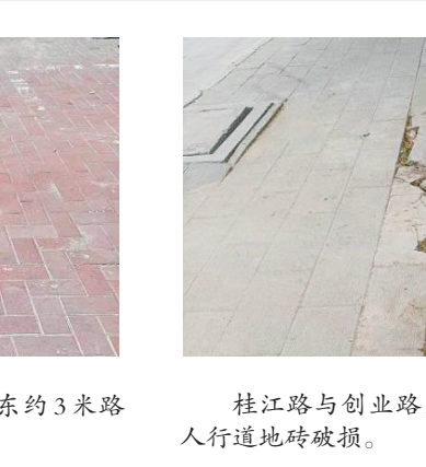
桂江路与创业路交叉口向西约120米路北,人行道地砖破损。