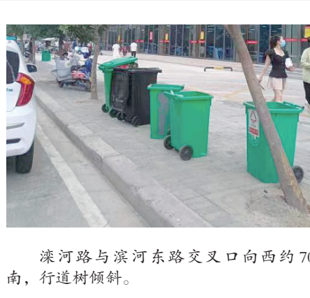
漯河路与滨河东路交叉口向西约70米路南,行道树倾斜。