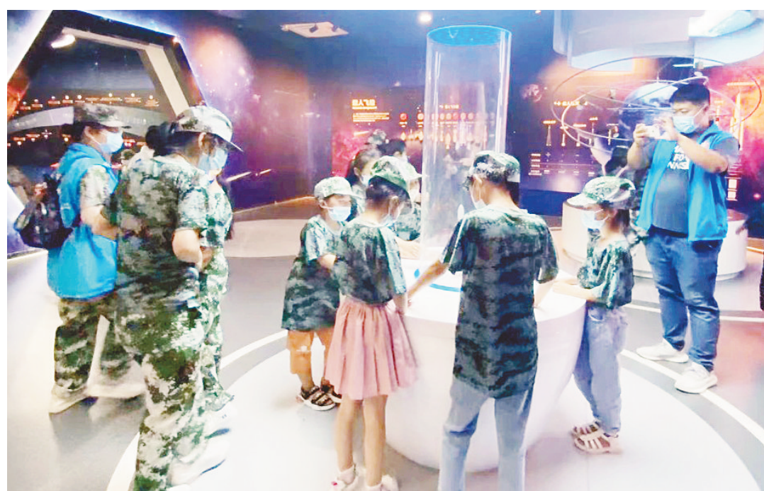
7月22日,舞阳县侯集镇社工带领辖区近30名脱贫户、监测户、低保户家庭的孩子到市科技馆,让孩子们了解科技发展对现代文明的影响,感受科技的魅力。