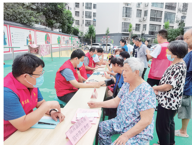
7月22日,源汇区马路街街道友爱社区联合市第二人民医院在人民路金汇花园小区开展以“我为群众办实事 健康服务进万家”为主题的义诊活动。

“从大漠孤烟塞北,到杏花春雨江南;从山水田园牧歌,到金戈铁马阳关。我们以诗词之心,吟诵千古名句,也让源远流长的中华文化得以传承下去。”本届诗词大赛评委马永灿老师说。