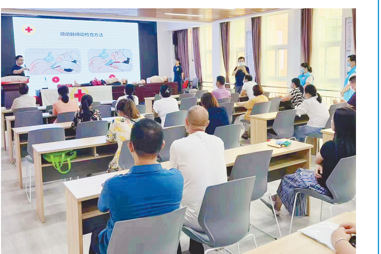
上图:7月22日,市红十字急救队应急服务队和龙塔街道社工站在郾城区龙塔街道金牛社区组织开展急救技能培训。