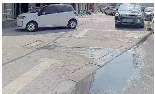
辽河路与尚德路交叉口向东约80米路北,下水道堵塞。