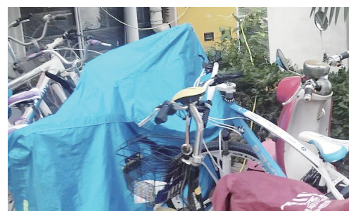
建赏小区,非机动车乱停乱放。