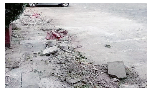
金江路与泰山南路交叉口附近,施工结束后路面未清理干净。