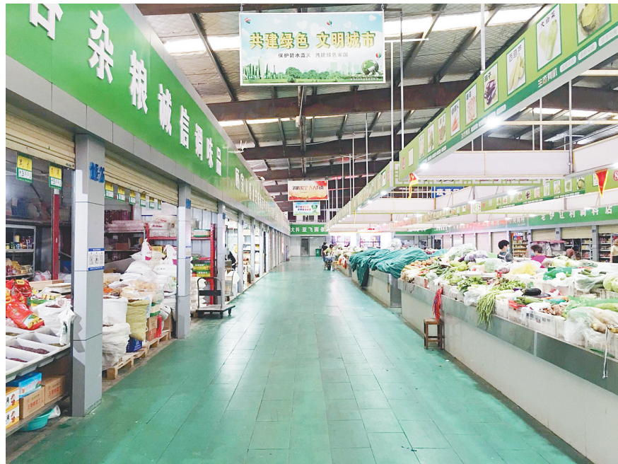
铁东农贸市场内地面干净、摊位规范整齐。