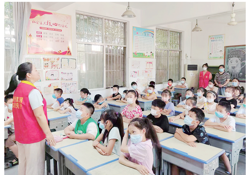
7月31日上午，源汇区老街街道滨西社区联合五一路小学举办未成年人心理健康知识专题讲座。

办学理念，坚持技能教育和学历教育相结合，倾力打造一支结构合理、优秀而稳定的“双师型”队伍，在通过“以赛促学”模式连年在全省、全国各类职业技能大赛上摘金夺银的同时，大力推进院校联合对口升学，对口升学率和优秀率在全省同类院校中连续多年名列第一。