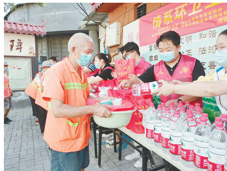
8月6日,共青团源汇区委、老街街道、漯河星火志愿团联合开展“情系环卫工 夏日送清凉”慰问活动,为环卫工送去了脸盆、毛巾、矿泉水等。