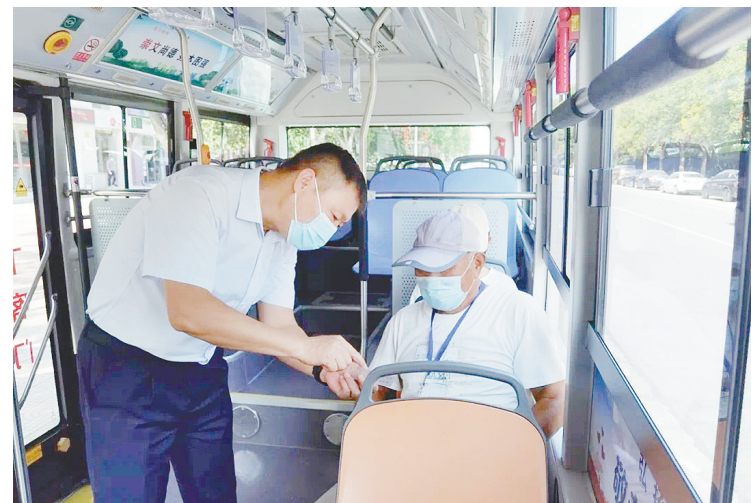
按照市疫情防控指挥部要求,市民乘坐公交车出行实行实名制登记。由于许多老年人没有智能手机,只能采取原始的纸质登记方式,这样老年人就需要出示身份证并报出手机号码。为方便老年人携带身份证,市公交集团定制做了数千个身份证卡套。图为8月5日,169路公交车车长为老年乘客发放身份证卡套。