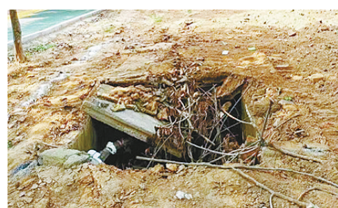
金山北路与淞江路交叉口向南约70米路东,井盖缺失。