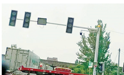
樟江东路与衡山路交叉口,交通信号灯不亮。