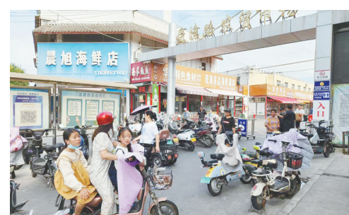
受降路农贸市场门口,非机动车乱停乱放。