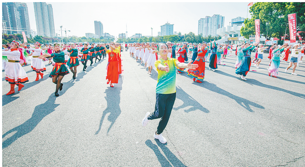
健身爱好者表演广场舞《共同的我们》。