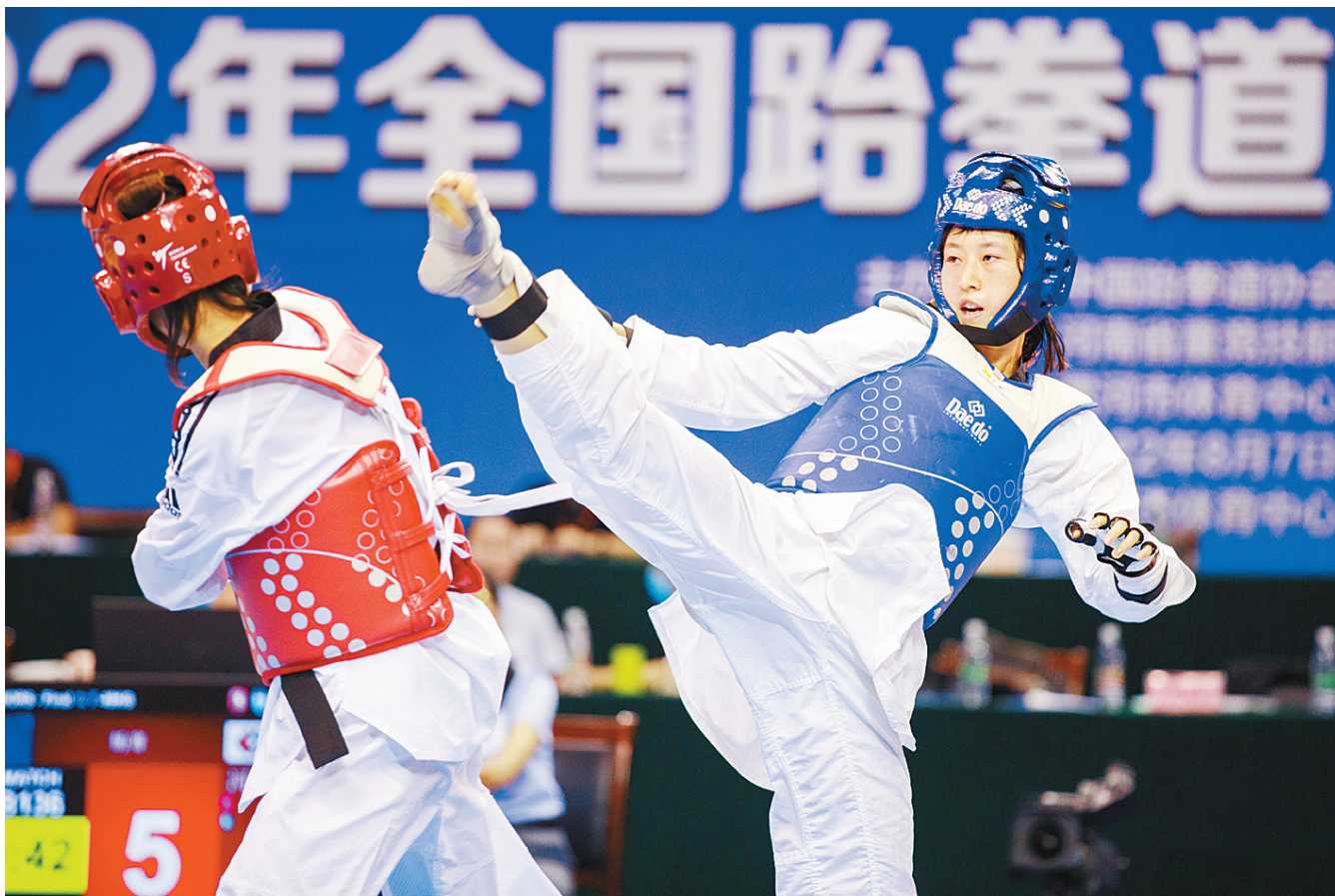
8月10日上午，2022年全国跆拳道锦标系列赛第一阶段比赛在漯开战。图为两名选手激烈对战。

本报讯(记者 杨光)8月10日上午，2022年全国跆拳道锦标系列赛第一阶段比赛在市体育中心拉开战幕。来自全国35支代表队的600余名选手将在10天的比赛中对战。