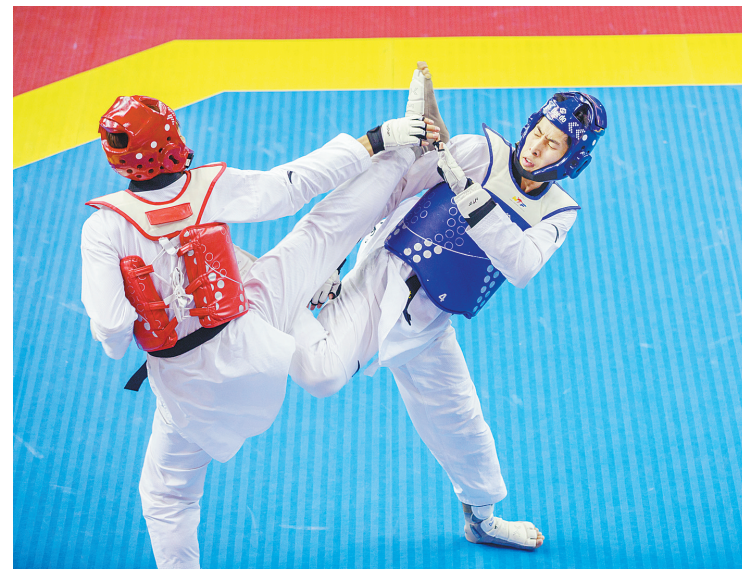
8月14日，2022年全国跆拳道锦标系列赛第一阶段第一站收官。图为两名选手激烈对战。

本报讯(记者 杨光)8月14日，2022年全国跆拳道锦标系列赛第一阶段第一站决出最后三个级别的冠军之后，在市体育中心圆满收官。