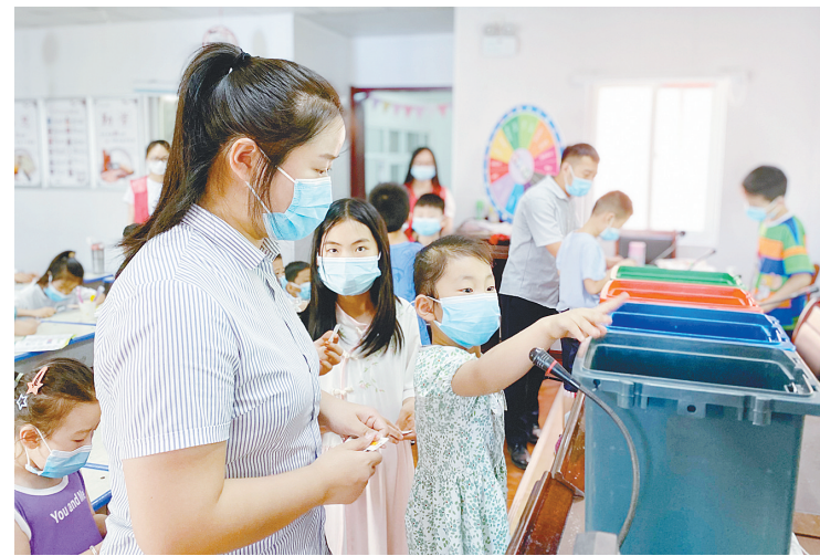
8月12日，共青团源汇区委邀请城发新环卫(漯河)有限公司工作人员为受降路社区居民讲解垃圾分类相关知识。