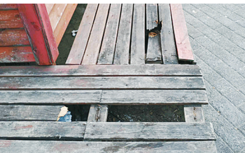
黄河西路与太行山路交叉口东南角，木制台阶破损。