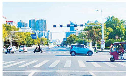
太行山路与大学路交叉口，交通信号灯不亮。