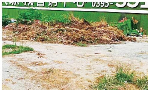
银鸽路与人民路交叉口向北约180米路东，垃圾无人清理。