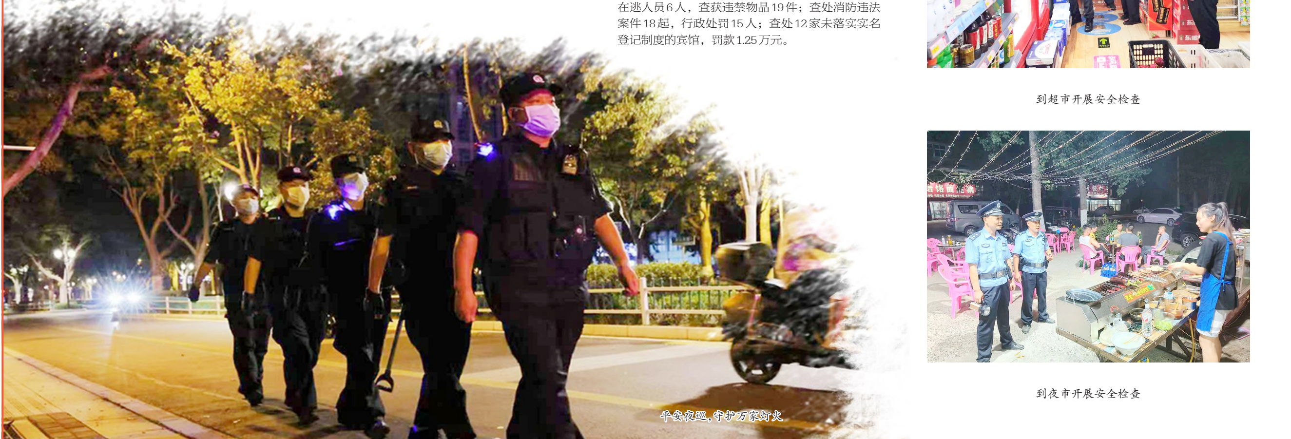
平安夜巡,守护万家灯火