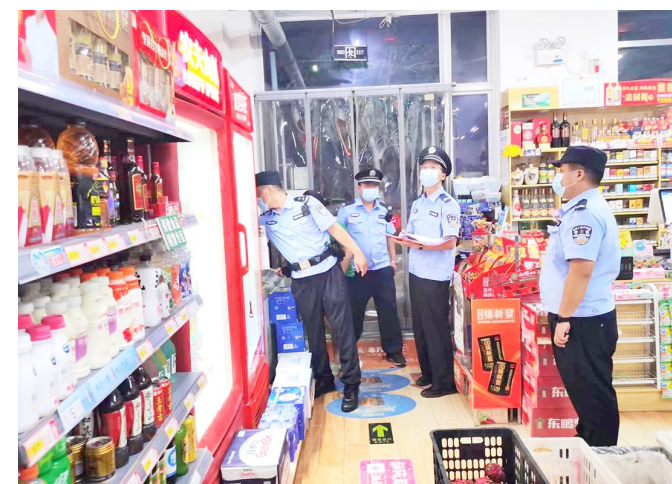
到超市开展安全检查