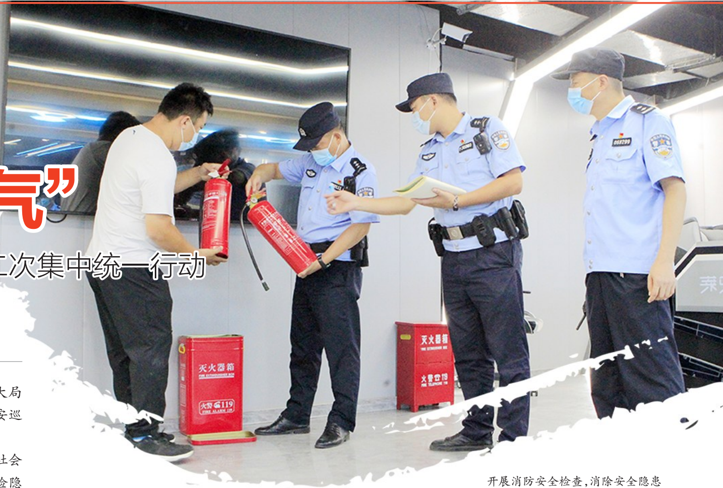
开展消防安全检查,消除安全隐患

行动中,全警听令而行、尽锐出战,充分发扬“亮剑”精神、发挥“守夜人”作用,根据夏季社会治安规律和夜间违法犯罪特点,严厉打击现行违法犯罪活动,有效防范、消除社会面安全风险隐患,确保社会治安大局持续稳定,切实提高人民群众的安全感、满意度。