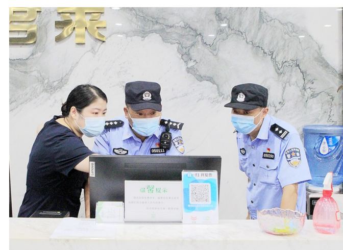
核实比对相关人员信息

全市公安机关共成立9个指挥部、156个巡查组,出动警力6150余人次、车辆1780余台次;检查场所1260余家次,排查消除安全隐患544处;打击现行违法犯罪31起,抓获现行违法人员38人、在逃人员6人,查获违禁物品19件;查处消防违法案件18起,行政处罚15人;查处12家未落实实名登记制度的宾馆,罚款1.25万元。