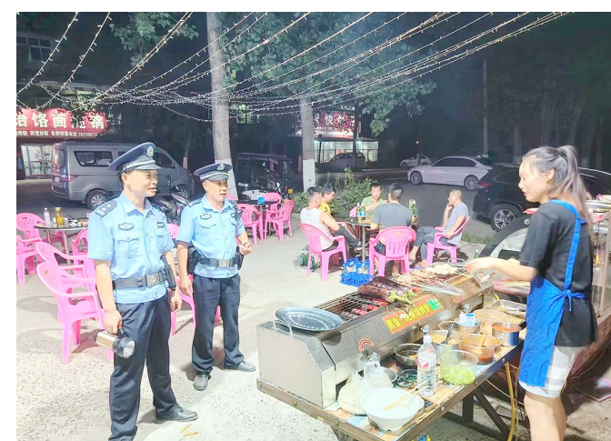
到夜市开展安全检查