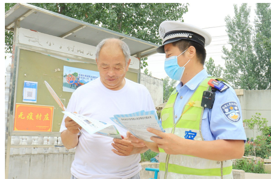
开展平安宣传活动

组织特警、社区民警及机关增援警力,广泛发动平安类社会组织、群防群治力量,针对广场、商圈、夜市、车站等重点场所及社会治安问题突出地区,快速打击处置酗酒闹事、寻衅滋事、打架斗殴、侮辱猥亵等违法犯罪行为,全面形成高压震慑态势,最大限度消除风险隐患、挤压违法犯罪空间,有力维护全市社会治安大局持续稳定。