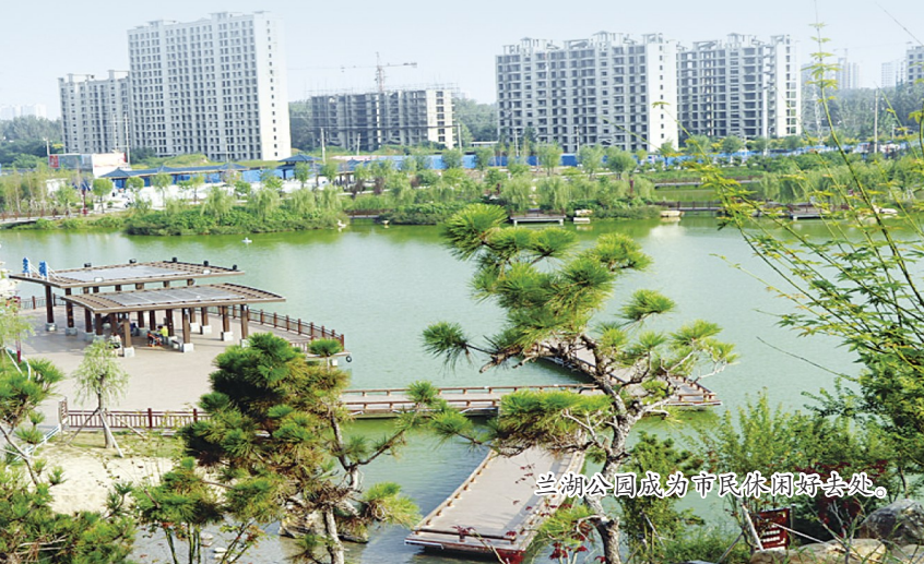
龙湖公园成为市民休闲好去处。

人民至上，造福人民。从2012年到2021年，临颍县城镇居民人均可支配收入和农民人均纯收入分别提升至31770元和20795元，千家万户的“幸福花开”也使得民生成为临颍县最温