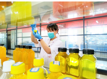
河南中大恒源生物科技有限公司。