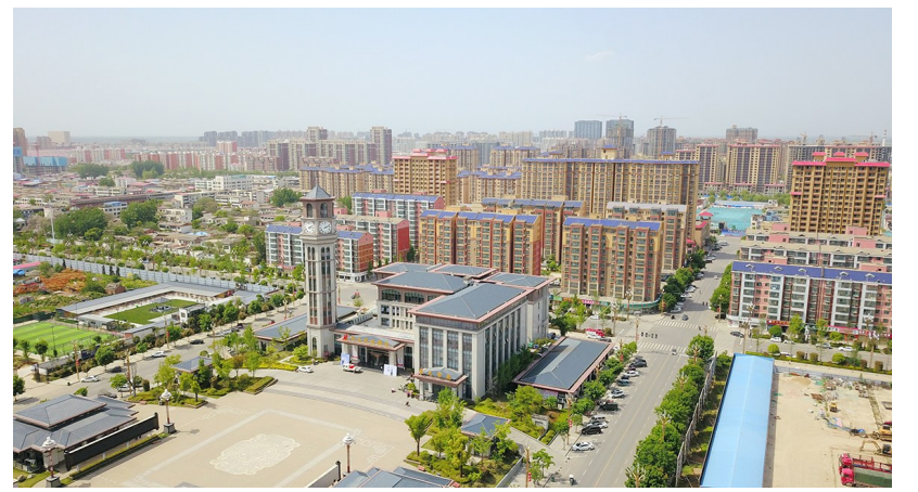
城市建设日新月异。

家，占全市三分之一，休闲食品、智能制造和板材家居三大主导产业产值突破500亿元。休闲食品产业入围河南省最具竞争力“百亿产业集群”，县经开区综合排序进入全省前20，现代家居园区获评全国十大木业产业园。建成省级工程技术研究中心、企业技术中心36个，是十年前的6倍；培育国家级、省级高新技术企业58家，是十年前的11.6倍。新增国家“专精特新”、重点小巨人、“瞪羚”等企业16家，建成全省唯一的省级膨化食品检验检测中心、省级板材产品质量检测中心。工业税收达到10.4亿元，是十年前的2.6倍；纳税超亿元企业达到3家、纳税超10万元企业达1134家，是十年前的4倍。