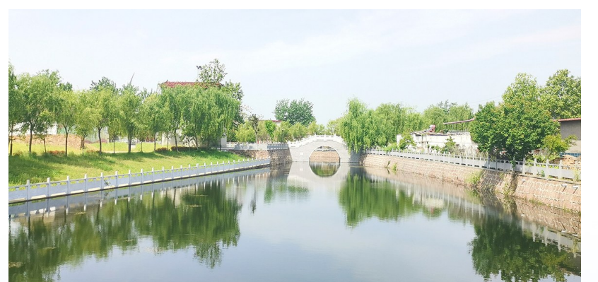
水系环绕的胡桥村成为乡村振兴的典范。

十年来，临颍县坚持不懈强“三农”、扬优势，乡村振兴全面推进。今年4月，国家现代农业产业园花落临颍；8月9日，临颍县又被确定为国家农业现代化示范区。目前，临颍县正在积极创建国家乡村振兴示范县。临颍县坚决扛稳粮食安全责任，建成高标准农田63万亩，占全部耕地