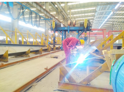
绿色装配式建筑生产车间。

2012年至2021年，临颍县生产总值年均增长8.2%，接近400亿元大关，是十年前的2.2倍；规模以上工业增加值年均增长9.4%，是十年前的2.4倍；固定资产投资年均增长15.6%，是十年前的4.2倍；社会消费品零售总额年均增长10.8%，是十年前的2.8倍；一般公共预算收入年均增长17.3%，突破20亿元，是十年前的5倍；税收年均增长17.6%，达到15.6亿元，是十年前的5倍；城镇居民人均可支配收入年均增长8.1%，达到31770元，是十年前的2.2倍；农村居民人均可支配收入年均增长10.2%，达到20795元，是十年前的2.6倍。县域经济高质量发展水平综合排序进入全省前20，县域工业经济入围全省30强，综合实力稳居全省第一方阵，先后获中国休闲食品之都、全国粮食生产先进县、“四好农村路”全国示范县、全省首批践行县域治理“三起来”示范县等100余项省级以上荣誉。