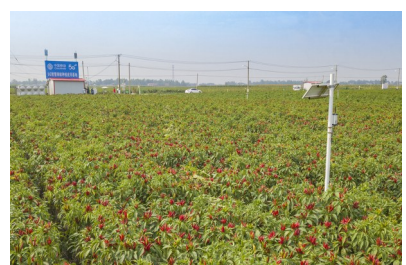
5G+智慧辣椒助力乡村振兴。

过去的十年，临颍县锐意进取抓改革、勇创新，发展活力竞相迸发，营商环境持续优化，开放联动不断强化，创新要素加快集聚……为经济社会高质量发展积蓄了强大动能。在开放发展的探索中，一项项改革措施相继落实，一家家企业扩能升级。“放管服”改革不断深化，“最多跑一次”高效落实，99.6%的审批服务事项达到四星标准，企业开办和