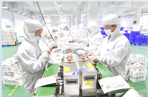
艾德奥宠物食品生产车间