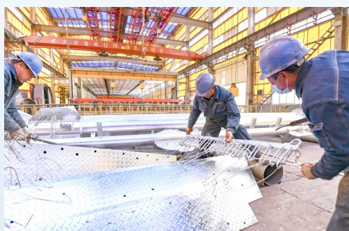
永光电力装备制造车间