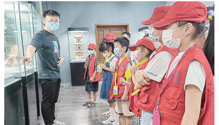
小记者参观德泽陶瓷博物馆。