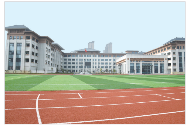
召陵区第二实验中学。