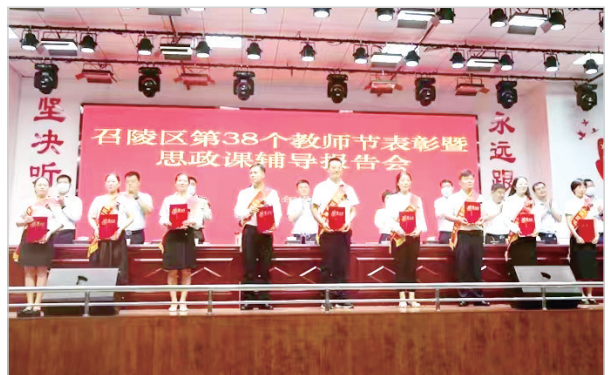
召陵区庆祝第38个教师节表彰会。