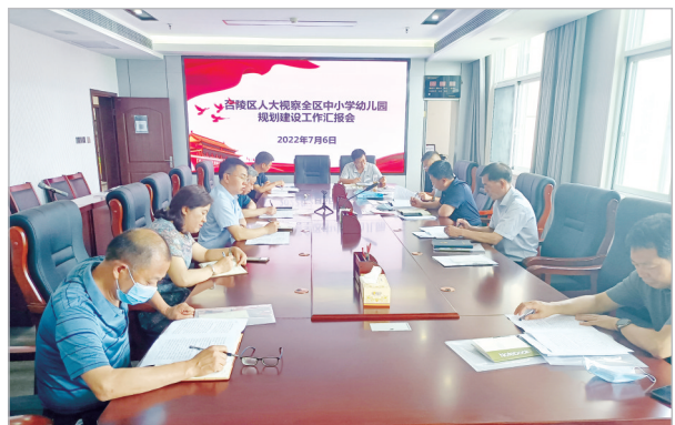
召陵区人大视察全区中小学校、幼儿园规划建设工作会议。