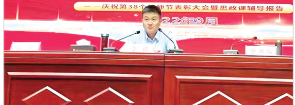
区委书记李湛为全区广大师生上思政课。