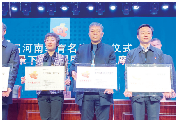
许慎中学被评为河南教育名片学校。