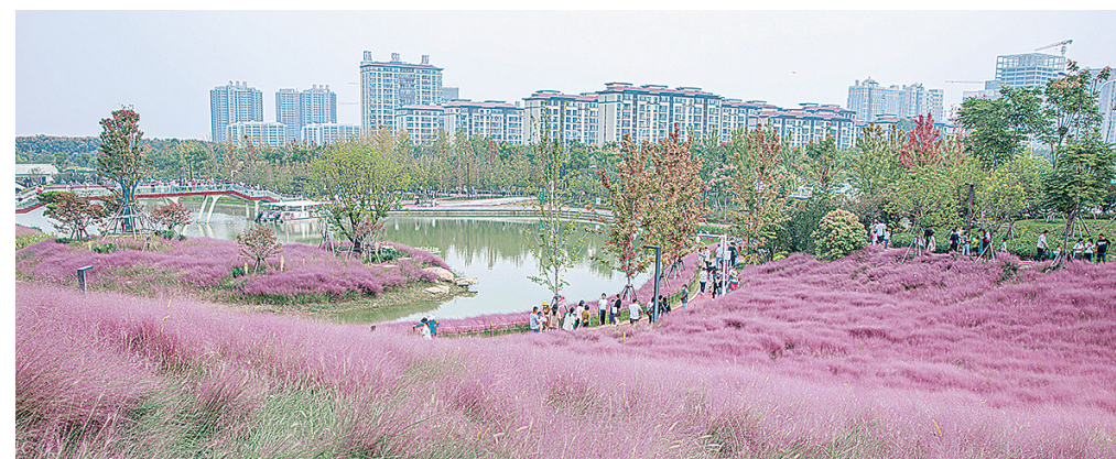
10月1日,市民在滙溪湿地公园游玩。