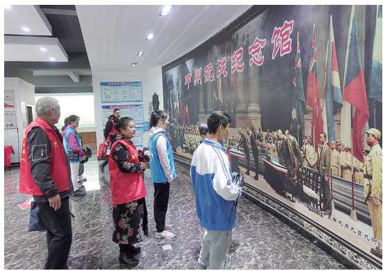
10月6日,孟庙镇社工站与漯河三铭吾公益中心组织孟庙镇辖区的孩子到中州抗战纪念馆参观。