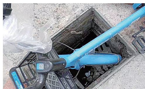
辽河路与白云山北路交叉口向西约220米路南,井盖缺失。