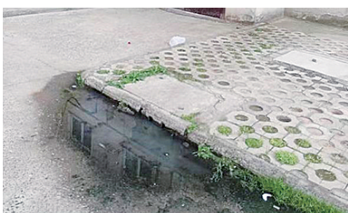
汉江路与太行山南路交叉口向东约70米路北,下水道堵塞。