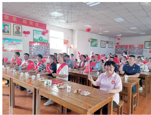
10月1日,市文明办联合公益团队漯河市妈妈团在五一一路雨花斋举办国庆联欢会。