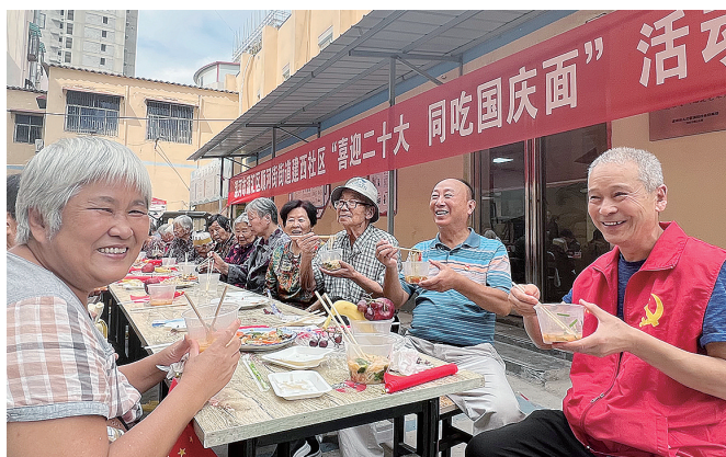
10月1日,源汇区顺河街街道建西社区在二针家属院开展国庆系列活动。