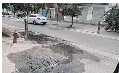
金山南路与金江路交叉口附近,下水道堵塞,污水外溢。