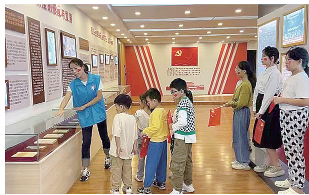
10月2日,郾城区龙城镇社工站社工在新时代文明实践所开展“喜迎二十大 童心向党”活动。