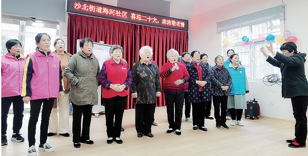
10月7日下午,海河社区举办了“幸福来敲门”敬老孝老活动。

一系列活动的举办不仅活跃了社区居民的业余文化生活,增强了邻里之间的沟通交流,还在社区营造了浓厚的敬老、爱老氛围,增强了社区的凝聚力。