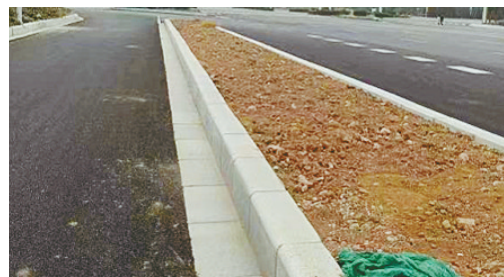
燕山路与牡丹江路交叉口向南约20米路西，黄土裸露。