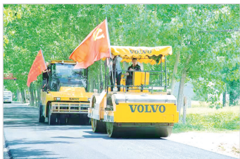
党旗在工程一线飘扬。