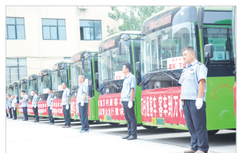
整装待发的农村客运。

大道如虹腾起飞，长路放歌谱华章。过去十年，召陵区交通运输系统以党建为引领，以打造人民满意交通为工作目标，以更宽的视野、更高的标准、更实的作风，织就了一条条促进经济发展和致富奔小康的交通网络。站在新的历史起点，召陵区交通运输系统将坚定信心、抢抓机遇，持续拼搏、加快发展，以更扎实的工作作风、更优异的成绩，向召陵人民提交一份更加满意的答卷。