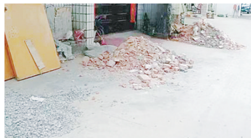
巴山路与阮庄路交叉口向南约70米路东，建筑垃圾无人清理。