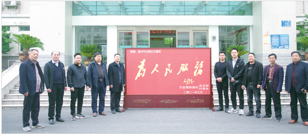
万金镇徐阁村给召陵区交通运输局送去牌匾。

这十年，召陵区交通运输系统坚持以党建引领各项事业全面进步，先后获得省级“四好农村路”示范县、省级“万村通客车提质工程”示范县等荣誉称号。成绩的取得凝聚着全系统党员干部的心血和汗水，更彰显着共产党人的为民情怀。