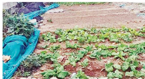
解放北路与黄河路交叉口向南约30米路西，有人毁绿种菜。