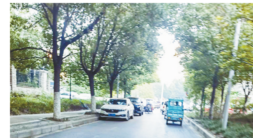
滨河西路与白云山中路交叉口附近，机动车乱停乱放，影响通行。