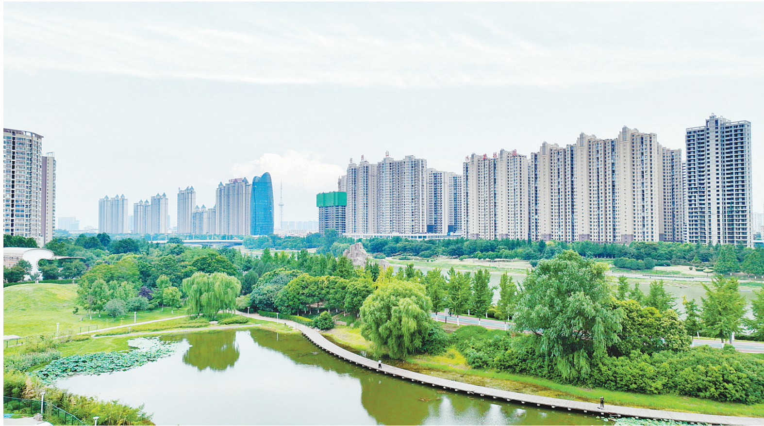
高楼林立，绿树水碧。

2021年7月，我市积极争取成为全国“公租房”APP十个试点城市之一。目前，漯河“公租房”APP已开通“资格申请”“进度查询”“资格年审”“公示公告”“自助缴费”“投诉建议”“政务服务评价”全部业务板块。今年8月，我市成为全国首个“公租房”APP电子合同在线签订功能测试成功的城市，实现了不用去