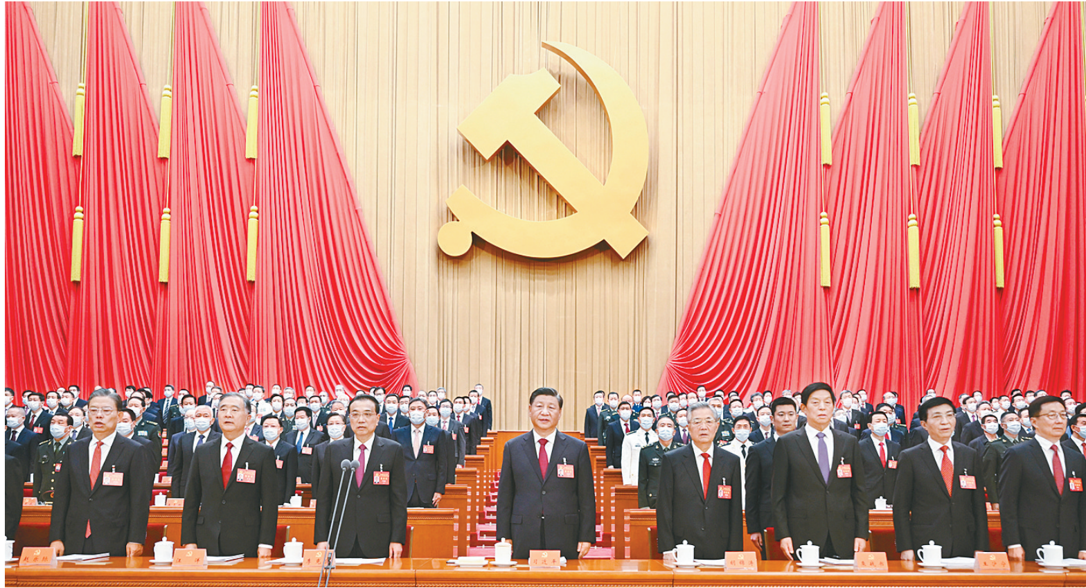
10月16日，中国共产党第二十次全国代表大会在北京人民大会堂开幕。这是习近平、李克强、栗战书、汪洋、王沪宁、赵乐际、韩正、胡锦涛在主席台上。

新华社北京10月16日电 凝心聚力擘画复兴新蓝图，团结奋进创造历史新伟业。举世瞩目的中国共产党第二十次全国代表大会16日上午在人民大会堂开幕。