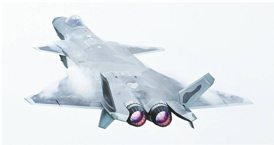
这是第十四届中国航展开幕式上的歼-20。

问：在地面展区，空军增加了“无人”与“反无人作战”板块，攻击-2无人机、无侦-7无人机、无侦-8无人机等装备一起亮