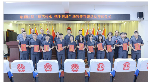
“传帮带”活动拜师仪式