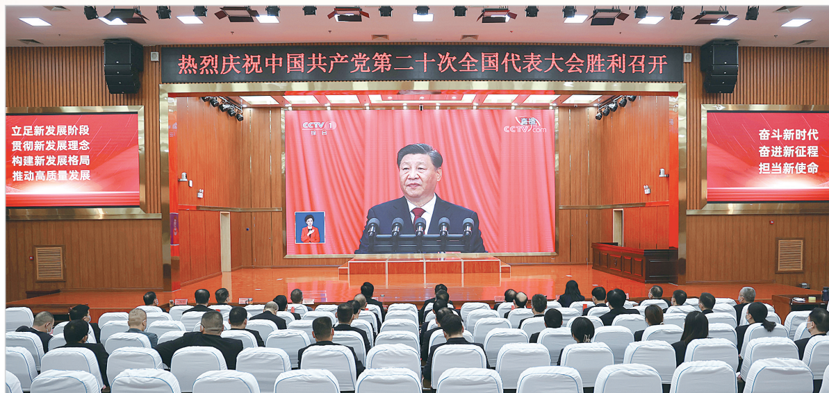
集中收听收看党的二十大开幕式