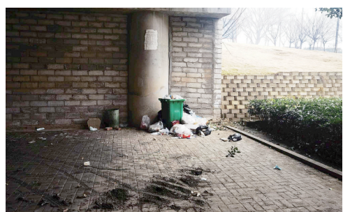
解放路沙河大桥桥下，垃圾清理不及时。