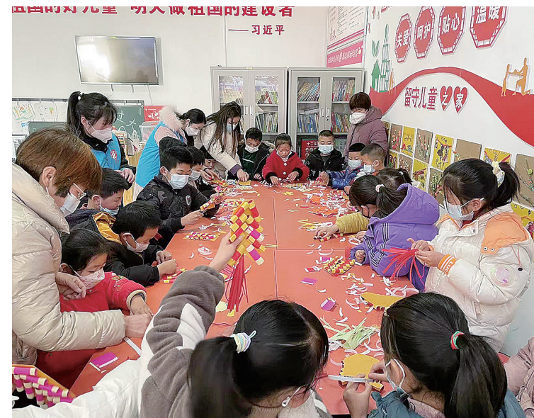
1月16日，舞阳县辛安镇刘庄村“儿童之家”开展迎新春手工制作活动。