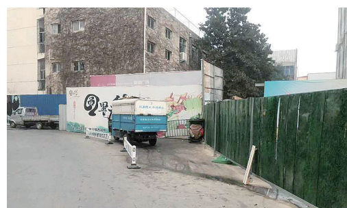
昌建广场附近，污水横流、臭味刺鼻。