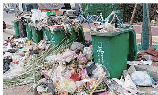
东北路与淞江路交叉口向南约100米路西，垃圾无人清理。