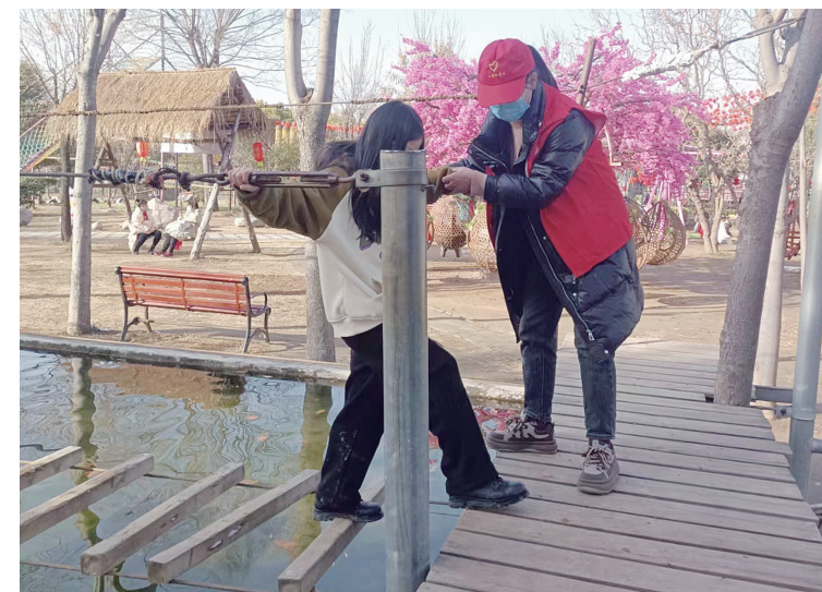
1月16日，小商桥景区志愿者为游客提供文明引导服务，确保游客安全。