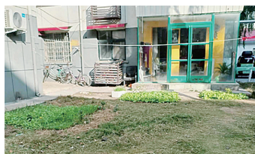
黄山路与淮河路交叉口向北约10米路东，黄山小区存在非法占绿毁绿现象。