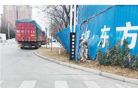
桐柏山路与淞江路交叉口向南约10米路西，围挡破损。