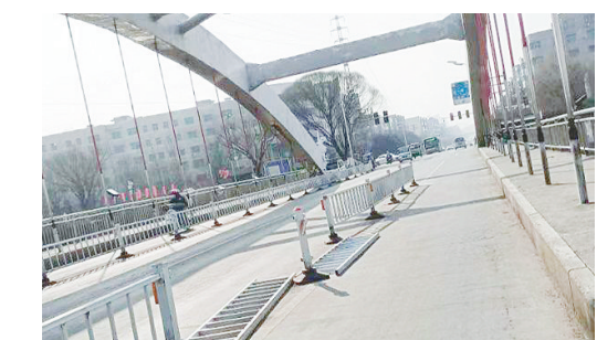
泰山路沙河桥上交通护栏脱落移位。