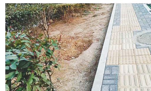
峨眉山路与湘江西路交叉口向北约30米路东，绿化带黄土裸露。