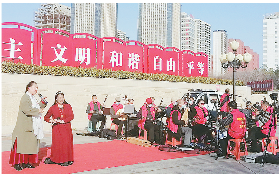
文韵文化艺术团在市科教文化艺术中心广场演出。

■文/图 本报记者 杨旭 “社会主义新时代,展望未来信心增……”2月28日,在龙塔街道祁山路社区会议室内,市文韵文化艺术团成员正在