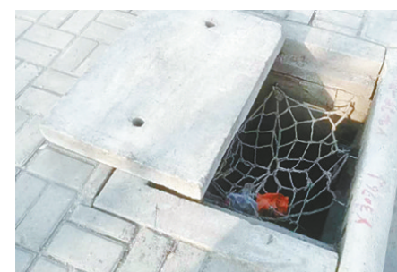
龙江西路与嵩山东支路交叉口向东约20米路南，井盖移位。