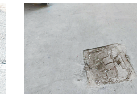
岷山路与辽河路交叉口向北约30米路东，路面破损。