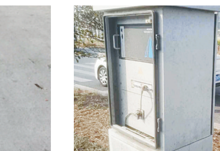
南大街与西大街交叉口向南约90米路中间，井盖损坏。