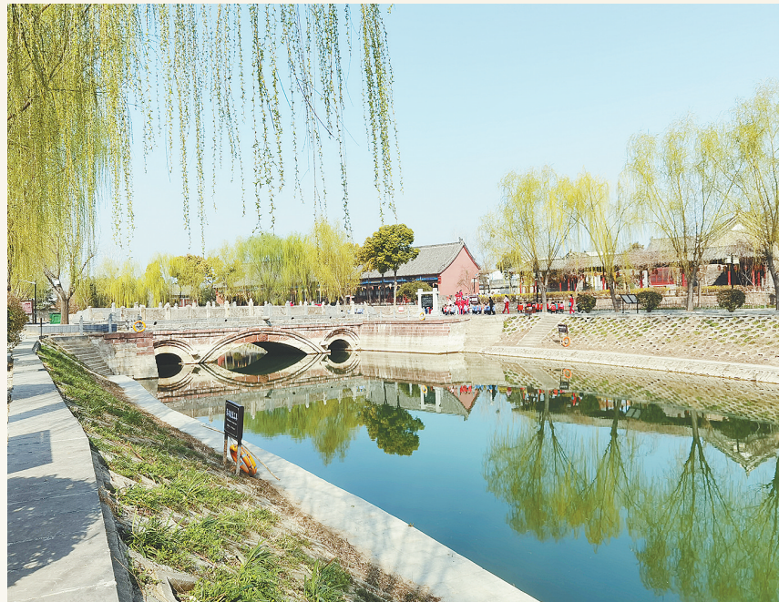
3月7日，小商桥两侧柳树萌芽，春意盎然，吸引游人无数。

金军对岳家军望风而逃，还有不少金将纷纷投降。金将韩常因在颍昌之战中大败，其部将夏金吾战死，遂屯兵于长葛不敢回去，秘密派遣使者联系岳飞，表示愿率领五万人投降。岳飞大喜，豪情满怀地对部下说：“直抵黄龙府（今吉林省长春市农安县，金军曾将徽、钦二帝囚禁于此），与诸君痛饮”。