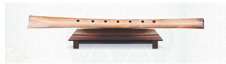
贾湖骨笛（仿制）摆件。