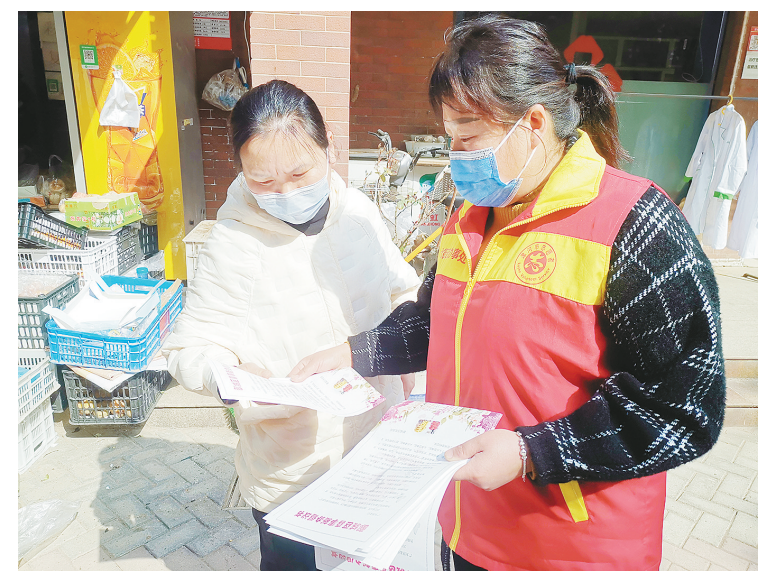
3月3日，郾城区沙北街道沙湾社区志愿者向辖区居民发放喜事办倡议书。本报记者 刘净涛 摄