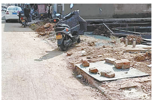
巴山路与营房北三巷交叉口向南约3米路西，人行道井盖缺失，用木板代替，存在安全隐患。