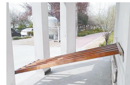
中山北路与秀水河路交叉口向南约50米路东，爱心驿站墙壁装饰框倾斜。