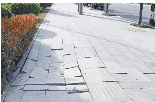
漓江路与庐山路交叉口向东约50米路南，人行道上路面塌陷。