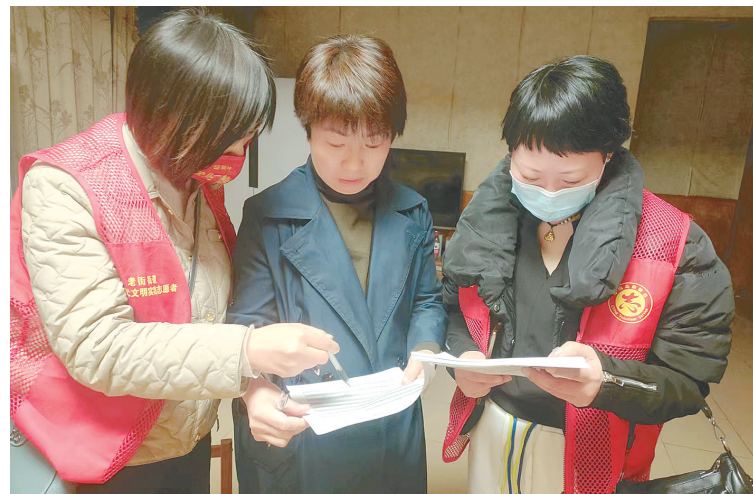
3月15日晚，源汇区老街道老社区新时代文明实践站工作人员联合共建单位志愿者、社区网格员等，开展全国文明城市测评入户问卷调查及宣传活动。