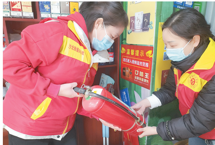
3月16日，郾城区沙北街道金山社区工作人员对辖区高铺开展消防安全和食品安全排查。