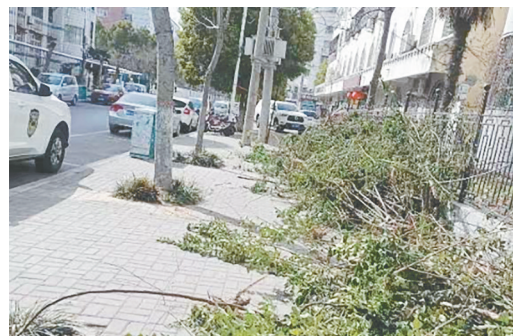
阳光街与祁山路交叉口向东约30米至90米之间路北，人行道上有树枝。