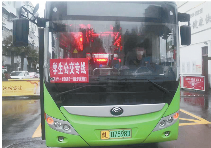
三月十六日下午，市公交集团学生公交专线车在学校附近等候学生放学。

接下来，市公交集团还将陆续开通多条公交专线，推出更多便民举措，提供特色公交服务，为市民出行提供便利。