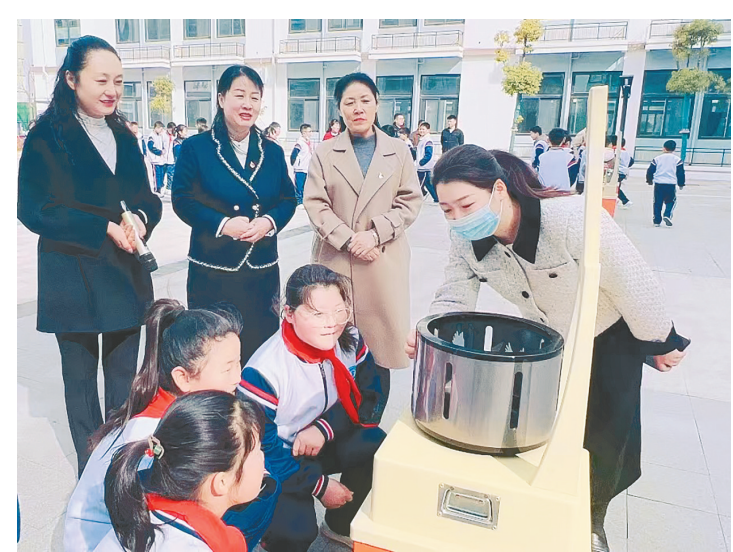
科技馆在郾城区龙湖学校开展科普活动。 三月十五日，郾城区科协联合区教育局、市科协在郾城区龙湖学校开展“科普大篷车”进校园活动。

用符合规定的材料，达到防火、防潮、可清洗的要求，配备足够的照明、通风、排烟装置和有效的防蝇、防尘、防鼠以及符合卫生要求存放废弃物品的设施和设备。有独立的食品原料存放点、食品加工操作间、食品发放场所，配有专用冷藏、洗涤、消毒设施。 该园根据幼儿的生理需求，以《中国居民膳食指南》为指导，由保健医生制订儿童膳食计划和食谱。伙房人员精心烹饪，力求达到色、香、味俱全，使幼儿喜爱。 此外，市直幼儿园每学期开展一次食品安全事故应急处置演练，建立健全幼儿园应对突发食品安全事故的救助体系和运行机制，全面提高园教职工应对突发事件和风险防范的能力。同时，该园开展形式多样的食品安全教育活动，教幼儿掌握食品卫生小常识，比如，做到饭前便后要洗手、不吃腐烂变质的食品、养成不乱吃零食的习惯；购买食品要到正规商店，不购买“三无”产品，购买食品时要注意看生产日期等。