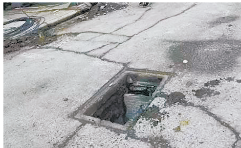
柳江路与太行山南路交叉口附近水景新苑小区6号楼前井盖断裂，存在安全隐患。