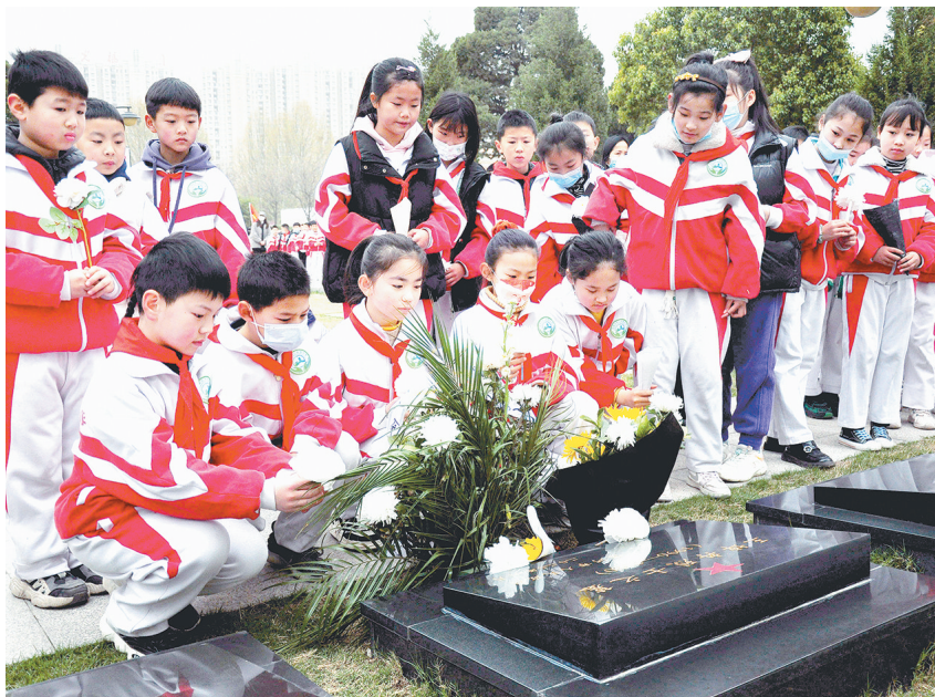
少先队员向王坤冉烈士献花。