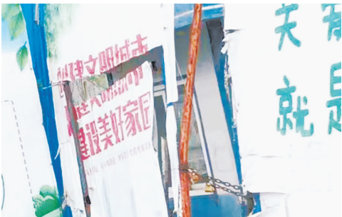
金江路与泰山南路交叉口向西约220米路北，开源工地围挡倾斜，公益广告破损。