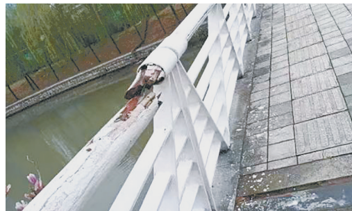
太白山中路与月湾湖西路交叉口向南约180米路西，护栏损坏。