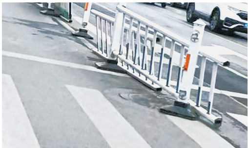
嵩山南路与长江路交叉口向南约10米路东，交通护栏损坏。