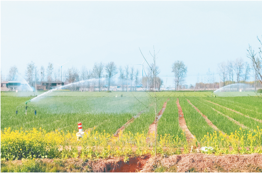
连日来，各县区抓住有利时机做好田间管理。图为3月27日，郾城区商桥镇党湾村村民利用灌溉设备为农作物浇水。