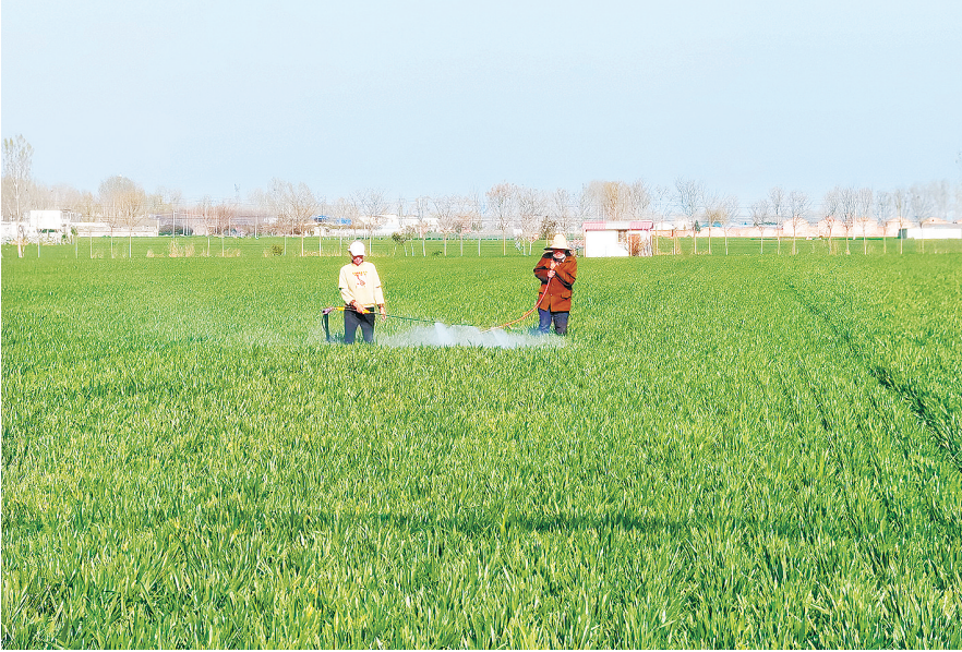
3月27日，郾城区龙城镇西刘村村民正在为小麦喷洒叶面肥。

目前，西城区招商引资工作呈现良好态势，储备了中国食品产业数字化总部园区、百度数字经济产业基地、麦腾永联众创空间、大数据产业园三期四期等一批在谈项目，为全年招商引资实现新突破打下坚实基础。 蔡卓艺 魏田园