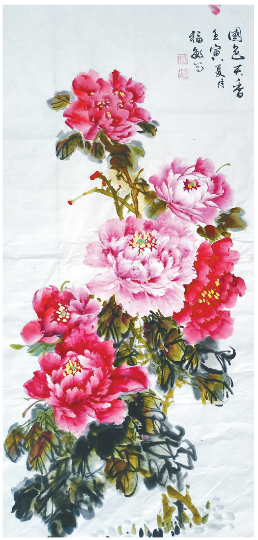
国色天香（国画） 杨福敏作

老井的水我饮用了二十多年，直到参加工作后离开家乡。工作后每次回老家，吃一碗妈妈用老井水做的捞面条，我总感觉格外好吃。临走前再喝几口老井的水，更让我心旷神怡。随着人们生活水平的不断提高，村里家家户户都用上了自来水，老井慢慢淡出了村民们的生活。退休后，我回老家的次数比原来多了。每次回家，我都会来到老井旁，凝神伫立。老井早已被弃用，井边杂草丛生，井口被一块大水泥板盖得严严实实。这口饱经岁月沧桑的老井有讲不完的故事，它见证了村民生活翻天覆地的变化，它曾经的甘甜依然滋润着我的心田。