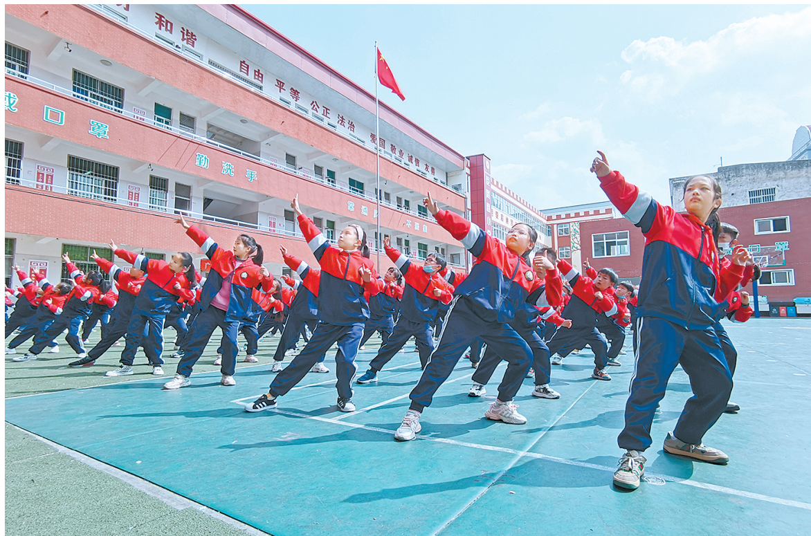
近日,源汇区教育局开展“最美阳光体育大课间”评比活动。图为源汇区受降路小学评比现场。