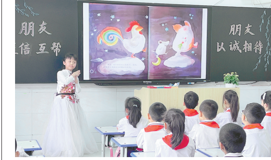
4月18日,郾城区东街小学举行“书香滋润童心 故事伴我成长”绘本故事演讲比赛。