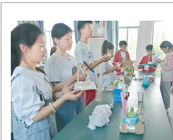
4月17日,青年镇前谢小学开展科技小制作展评活动。