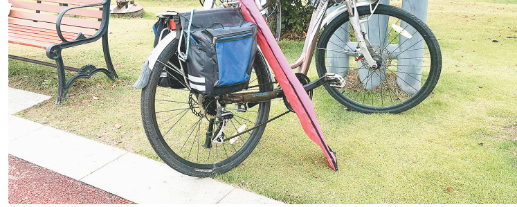
5月3日,沙澧河风景区红枫广场,一些市民为图方便,随意将自行车停放在草坪上。