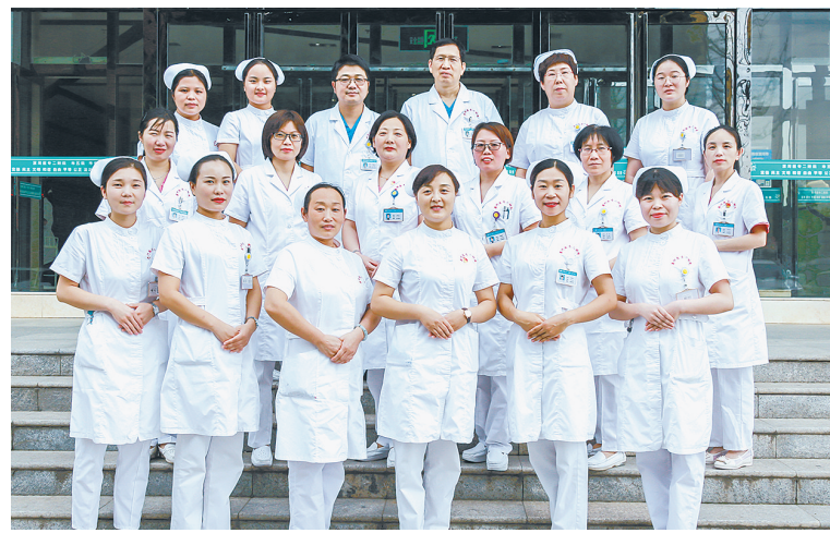
市骨科医院内分泌科团队。