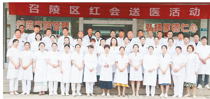
召陵区万金镇卫生院团队。

■文/图 本报记者 刘彩霞 召陵区万金镇卫生院始建于1966年9月，是一家集医疗、预防、保健、健康教育、康复指导于一体的综合性医院，肩负着该镇7.6万人及周边群众的医疗工作。该院多次被市、区卫健委评为老百姓放心医院。2018年，该院被国家卫健委评为群众满意的乡镇卫生院。2020年，该院在国家卫健委开展的“优质服务基层行”活动中表现突出，被国家卫健委、国家中医药局通报表扬。2021年，该院被市卫健委评选为“六好”医院。