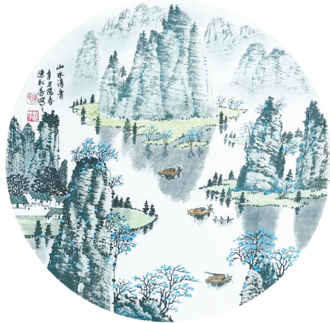
国画 山水清音 陈松芳作