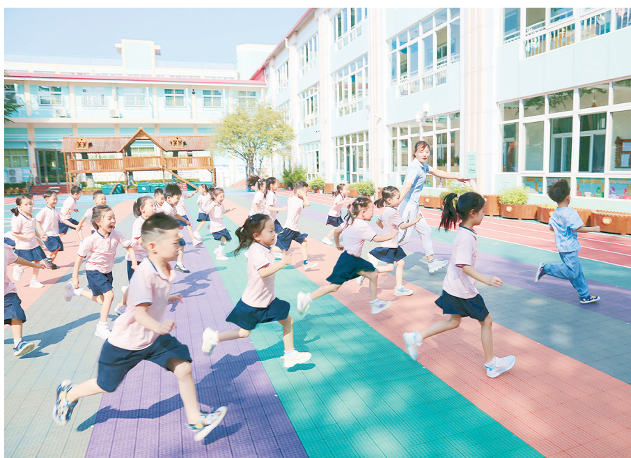
近日,市实验幼儿园开展反恐防暴安全演练。