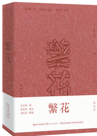
《繁花:批注本》 金宇澄 著 沈宏非 批注