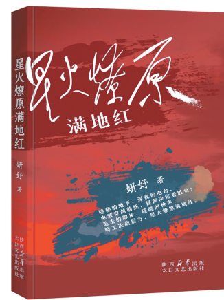
《星火燎原满地红》 妍妍 著

本书讲述了“九一八事变”后,日本侵占中国东北三省,中国民众奋起反抗。一个深受封建思想浸染的青年在经历种种事件后彻底转变思想,投入共产主义事业的怀抱,最终成长为共产主义战士,为革命奋斗终生。