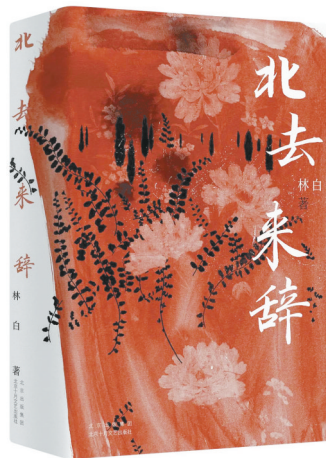
《北去来辞》 林白 著

本书讲述了“九一八事变”后,日本侵占中国东北三省,中国民众奋起反抗。一个深受封建思想浸染的青年在经历种种事件后彻底转变思想,投入共产主义事业的怀抱,最终成长为共产主义战士,为革命奋斗终生。