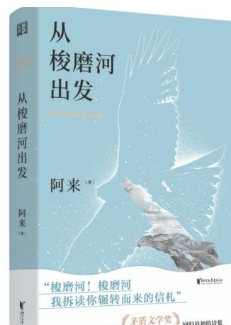
《从梭磨河出发》 阿来 著

《繁花》穿插于20世纪60年代和90年代之间,人物在两个时空交错叠替,以独特的沪语和语本式表达,书写了一部上海的繁华传奇。《繁花:批注本》在原著的基础上对其中方言词汇、特殊表达、重点情节加以批注和鉴赏,解读《繁花》一书的精巧结构和艺术细节,带领读者深入感受《繁花》的美妙世界。